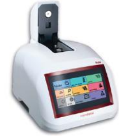
Mikro Hacimli Spektrofotometreler