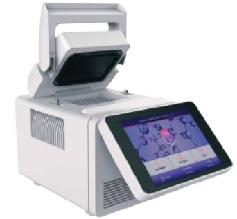
1D / 2D Gradient PCR Cihazları